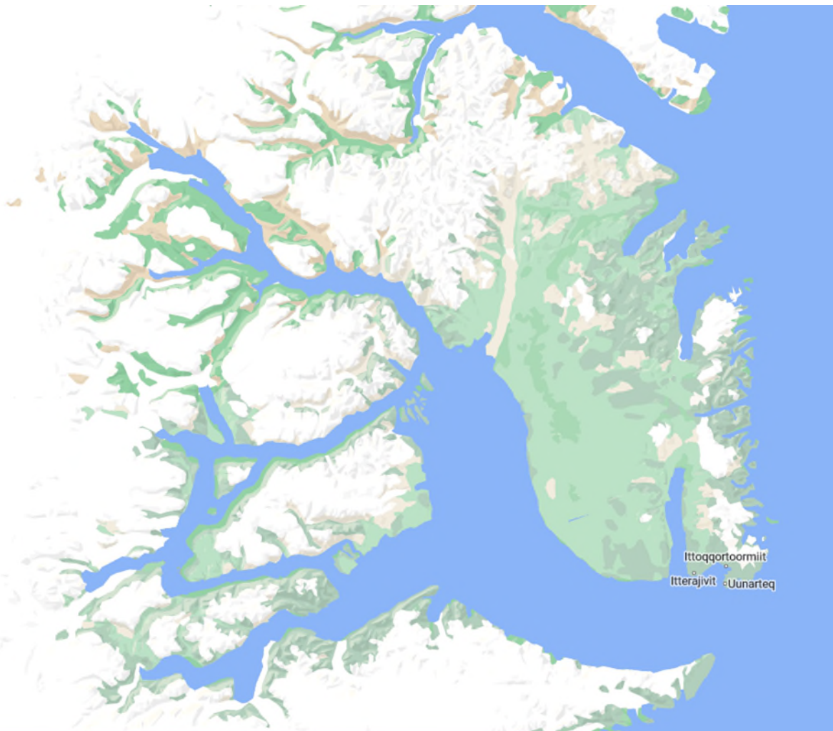
Abbildung 1. Der Scoresby-Sund ist das größte und längste Fjordsystem der Welt

Seit Wochen herrschen in Deutschland und im übrigen Europa extreme Temperaturen mit mehr als 40 Grad Celsius in der Spitze. In den letzten Jahren habe ich es mir zur Angewohnheit werden lassen, in den Sommermonaten diesen höllischen Temperaturen zu entfliehen und irgendwohin zu reisen, wo es im Hochsommer noch erträglich ist. Dafür kommt eigentlich nur der europäische oder amerikanische Norden in Frage, aber auch sonst bin ich wahrscheinlich jemand, der die Herausforderung sucht. Außerdem versuche ich das Klischee zu hinterfragen, ob in Grönland zur Zeit seiner Entdeckung wirklich mediterrane Zustände herrschten. Jener Erik der Rote, der als der Entdecker Grönlands gilt, hat diese Insel nicht zufällig entdeckt, sondern nur, weil er aus Norwegen fliehen mußte, wo man ihm diverse Verbrechen anlastete. Die Entdeckung Grönlands war also aus der Not geboren. Nichtsdestotrotz darf man die seefahrerische Leistung, die diese Entdeckungsfahrt darstellt, nicht unterschätzen. Man kann sich nur schwer vorstellen, wie es diesen Männern damals ergangen hat, die aufbrechen mußten, um sich ein neues Zuhause zu suchen. Angetan von ihrer Eroberung können sie jedenfalls nicht gewesen sein, als sie um 900 hier ankamen. Die Frage, ob Grönland, welchem als arktische Insel eher die Vorstellung anhaftet, mit dicken Eismassen bedeckt zu sein, wirklich so war wie behauptet, konnte ich mir nur dadurch beantworten, daß ich mir vor Ort selbst ein Bild davon